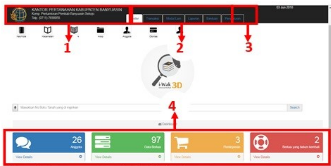
Gambar 4. Halaman beranda Aplikasi i-Wak

Halaman beranda pada Aplikasi i-Wak merupakan halaman pertama kali yang kita lihat pada saat dibuka. Halaman beranda ini dapat dilihat seperti di gambar 4.