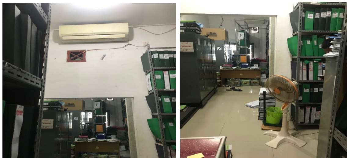
Gambar 1. Pengatur suhu ruang arsip

Pada Kantor Pertanahan Kabupaten Banyuasin sendiri penataan berkas disimpan dengan Buku Agenda. Dengan cara/sistem ini berkas-berkas arsip dicatat dalam suatu Buku Agenda secara berurutan. Kemudian berkas arsip disimpan menurut urutan sesuai dengan nomor urut dalam bukunya, atau dalam penataan berkas arsipnya diletakkan berdasarkan kelompok masalah. Ini sudah bisa menunjukkan pula unit pengolahnya. Untuk perawatan arsip telah disimpan di dalam rak/almari tersendiri dan dalam ruangan khusus. Namun ruangan arsip ini memiliki AC tetapi tidak berfungsi dengan baik sehingga suhu ruangan tidak stabil dan hanya mengandalkan satu kipas angin saja. Kondisi cahaya di dalam ruangan sudah baik dengan tidak memakai lampu yang terlalu terang. Ruangan ini juga telah dilengkapi dengan alat pemadam kebakaran dan telah ada tulisan “BAGI YANG TIDAK BERKEPENTINGAN DILARANG MASUK” hanya saja tulisan “DILARANG MEROKOK” belum ada.