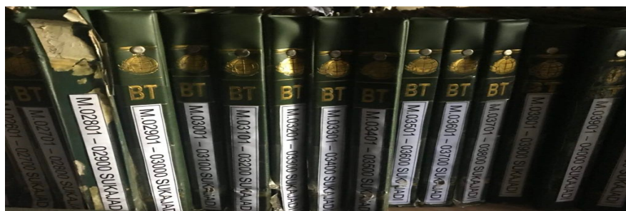
Gambar 3. Pengelolaan arsip

Warkah dan buku tanah disampul dan dicantumkan berdasarkan nomor urutannya untuk memudahkan mencari, mengambil dan menyusunnya kembali. Warkah dan buku tanah yang sudah dijilid dibedakan dengan memberi kode pada sampul.