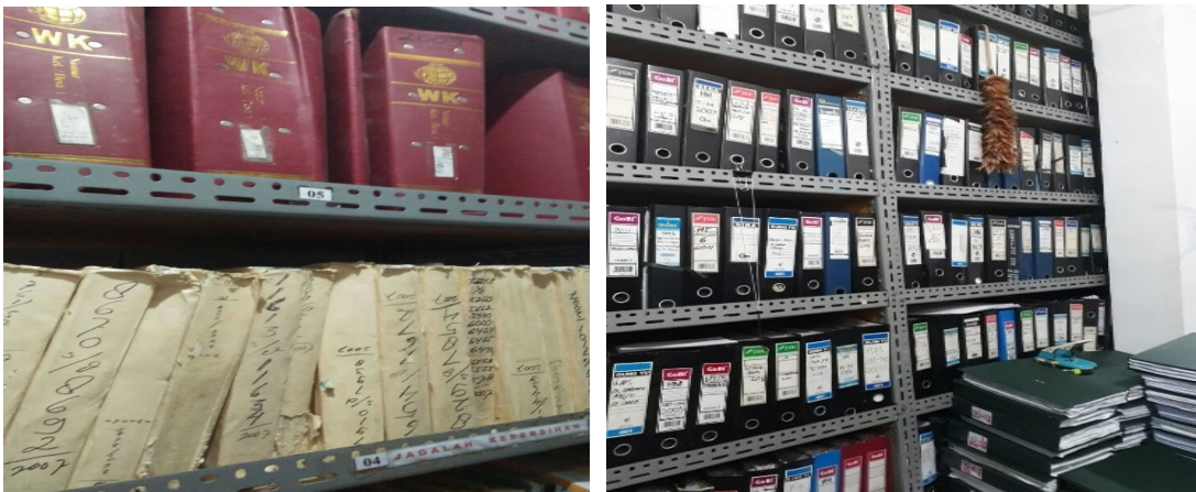
Gambar 2. Penyimpanan arsip.